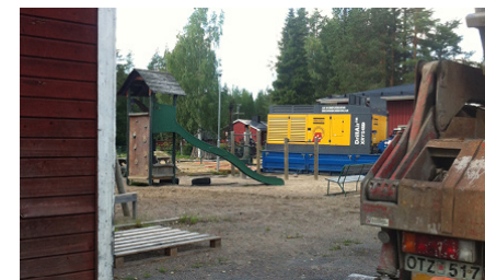
Bakom lastbilen skymtar en rutschkana.

På måndag slår alltså förskolan upp sina portar. Måndagen därpå är det skolstart. Ombyggnaderna beräknas bli färdiga i tid. Det ser ljus och fräscht ut för byns barnomsorg.