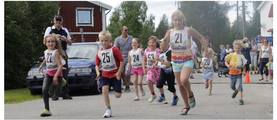
Vid slutet av dagen hölls knattelopp arrangerat av Visträsk idrottsförening. Barn i alla åldrar tävlade om festis och bullar, och alla vann.