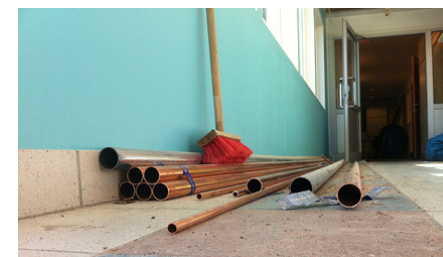
Ny uppvärmning betyder en del rörinstallationer.