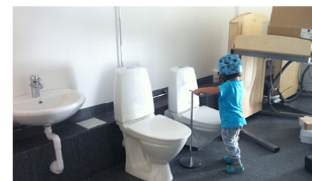
Matti Sandman, 2,5, testar höjden på de nya toastolarna.